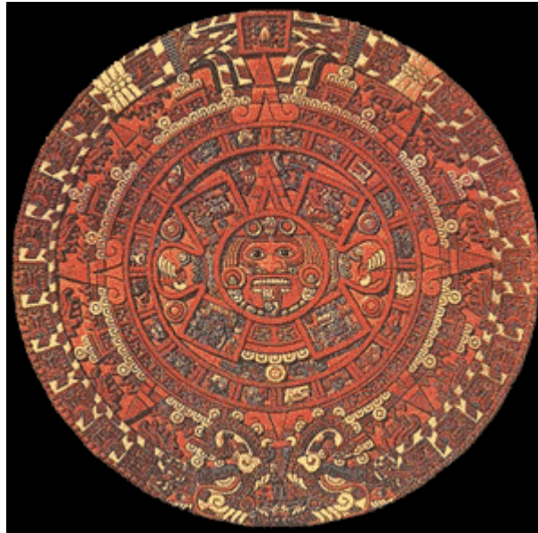
Le Tzolkin : l'un des 17 calendriers mayas

Exemple, dans l'année dite « du Roseau », un jour y est mentionné en tant que très important pour les Amérindiens. Ce jour correspond au dimanche de Pâques du 21 Avril 1519, jour où Hernando Cortez et sa flotte de 11 galions espagnols arrivèrent du vieux continent et accostèrent sur la côte bordant ce qui est aujourd'hui devenu la ville de Vera Cruz au Mexique. Quand les navires espagnols apparurent à l'horizon, les populations indigènes les observèrent et attendirent de voir ce qui allait se passer. Les voiles ondulantes des navires ressemblaient vraiment à des vols de papillons rasant la surface de l'océan. Or, cette arrivée était justement annoncée par le calendrier Tzolk'in sous la forme d'un vol de papillons.